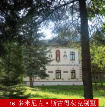
16 多米尼克·斯古得茨克别墅