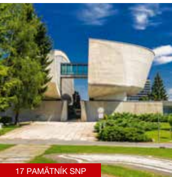
17 PAMÁTNÍK SNP