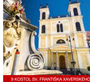
9 KOSTOL SV. FRANTIŠKA XAVERSKEHO