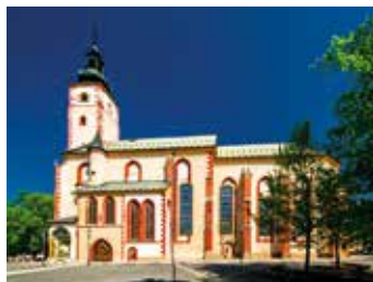
6 “圣母玛丽亚上天堂”教堂