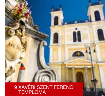
9 XAVÉRI SZENT FERENC TEMPLOMA