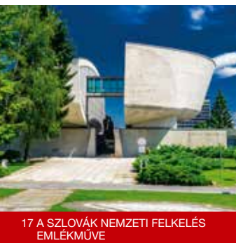
17 A SZLOVÁK NEMZETI FELKELÉS EMLÉKMŰE