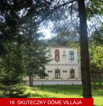
16 SKUTECKZY DÖME VILLÁJA