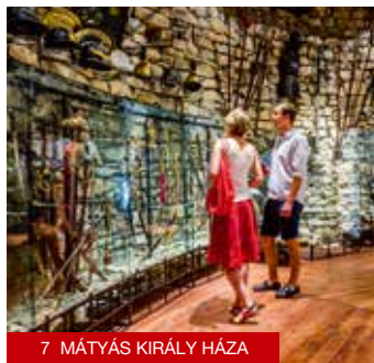
7 MÁTYÁS KIRÁLY HÁZA