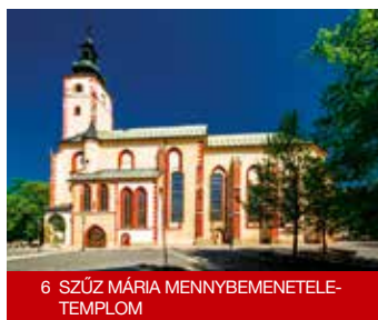
6 SZŰZ MÁRIA MENNYBEMENETEL-TEMPLOM