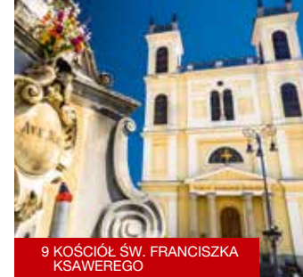
9 KOŚCIÓŁ ŚW. FRANCISZKA KSAWEREGO