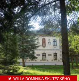
16 WILLA DOMINIKA SKUTECKÉHO