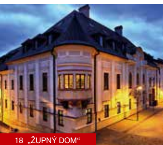
18 „ŽUPNÝ DOM“