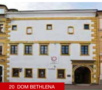
20 DOM BETHLENA