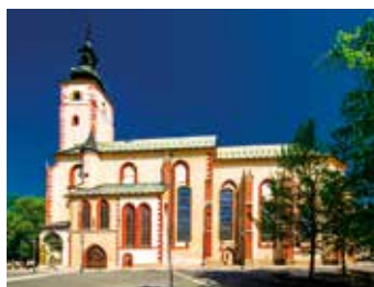
6 KOŚCIÓŁ WNIEBOWZIĘCIA NMP