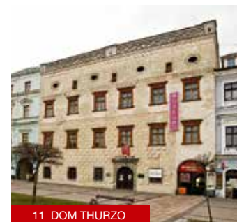
11 DOM THURZO