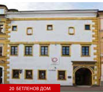
20 БЕТЛЕНОВ ДОМ