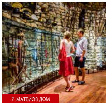
7 МАТЕЙОВ ДОМ