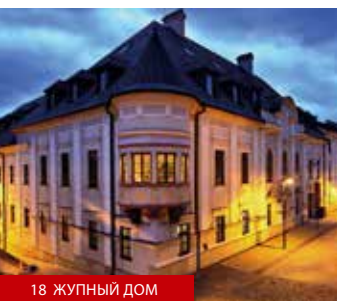
18 ЖУПНЫЙ ДОМ