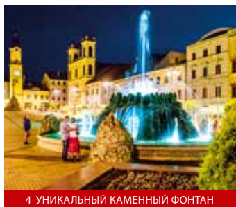
4 УНИКАЛЬНЫЙ КАМЕННЫЙ ФОНТАН