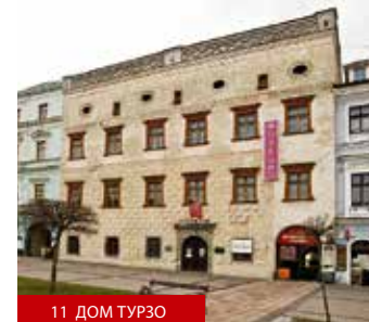
11 ДОМ ТУРЗО