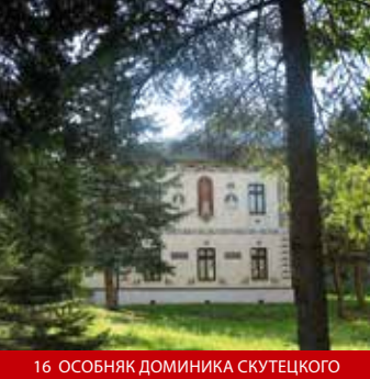
16 ОСОБНЯК ДОМИНИКА СКУТЕЦКОГО