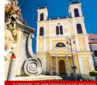
9 ЦЕРКОВЬ СВ. ФРАНТИШКА КСАВЬЕРСКОГО