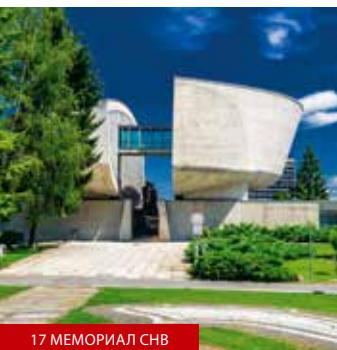
17 МЕМОРИАЛ СНВ