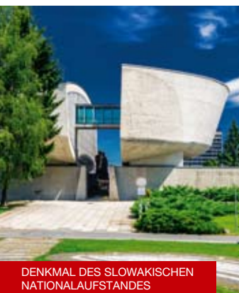
DENKMAL DES SLOWAKISCHEN NATIONALAUFGSTANDES

Tipp: Besichtigung der Stadt Banská Bystrica mit einem Stadtführer Informationszentrum BB, Nám. SNP 1, Banská Bystrica 048/415 5085, 0907 846 555 ic@banskabystrica.sk www.icbb.sk