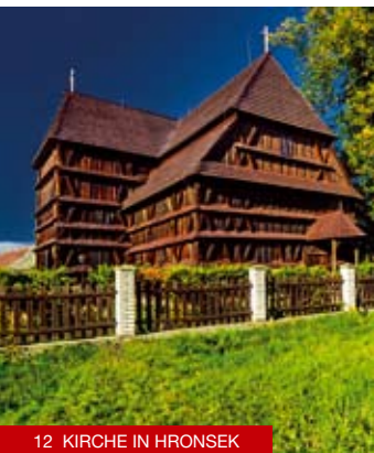
12 KIRCHE IN HRONSEK