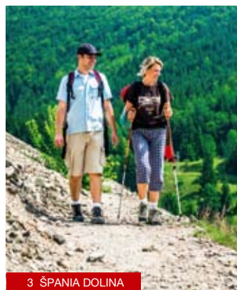
3 ŠPANIA DOLINA

1 Flusswanderfahrten auf dem Fluss Hron Erleben Sie tollen Spaß mit einem Hauch von Adrenalin bei einer Bootstour auf dem Fluss Hron. Das Bootshaus „Na Mlynčoku“ in Slovenská Lupča sorgt für komplette technische Versorgung einschließlich des Verleihs und Transports von Ausrüstung und Booten. www.splavhrona.sk