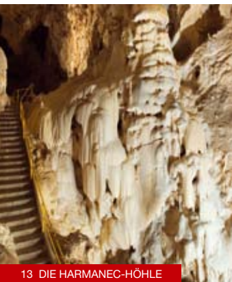
13 DIE HARMANEC-HÖHLE

11 Špania Dolina: Das malerische Bergmannsdorf wurde zum Denkmalsreservat der Volksarchitektur erklärt. Im Ort dominiert die frühgotische Kirche der Verwandlung des Herren aus dem Jahre 1254. Auf dem Platz finden Sie die bedeutendste Bergbau-Sehenswürdigkeit – den Klopfturm aus dem 16. Jahrhundert, in dem sich das Museum für Spitzen befindet, sowie das historische Gebäude der ehemaligen Bergverwaltung (heutiges Gemeindeamt), in dem das Museum „Unser Kupfermuseum“ untergebracht ist. www.spaniadolina.sk