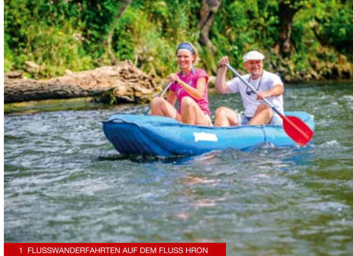
1 FLUSSWANDERFAHRTEN AUF DEM FLUSS HRON