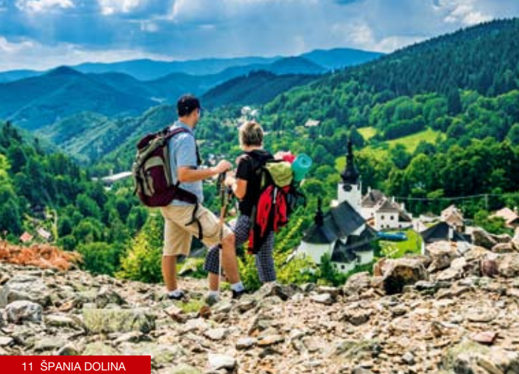
11 ŠPANIA DOLINA