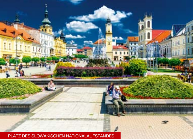
PLATZ DES SLOWAKISCHEN NATIONALAUFGSTANDES