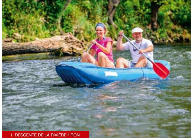
1 DESCENTE DE LA RIVIÈRE HRON