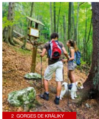
2 GORGES DE KRÁLIKY

Notre conseil : Visite guidée de la villa de Banská Bystrica Syndicat d'initiative de BB Nám. SNP 1 Banská Bystrica +421 48 415 5085 +421 907 846 555 ic@banskabystrica.sk www.icbb.sk