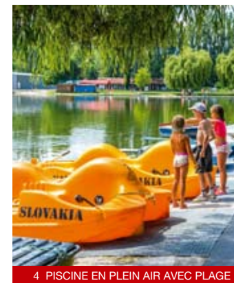
4 PISCINE EN PLEIN AIR AVEC PLAGE