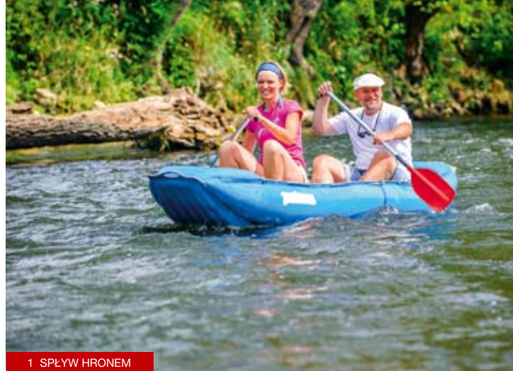
1 SPLÝV HRONEM