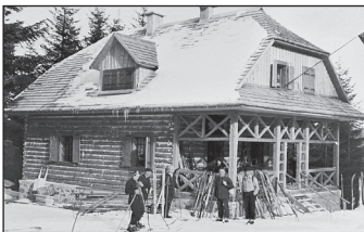
1932 - Chata na Suchom vrchu