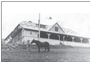
1932 - Chata pod Chabencom