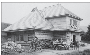
1928 - II. Chata Kráľova studňa