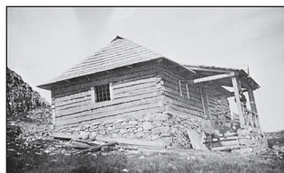
1927 - I. Chata Kráľova studňa