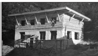
1938 - III. Chata Kráľova studňa

V plánoch bystrického Odboru KČST v rokoch 1937-1938 bola aj stavba lanovky na Majerovu skalu, lodenice pri Hrone, chát na Donovaloch, Prašivej a v sedle Rybô – k realizácii zámernov však už neprišlo.