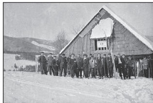
1925 - Pod Trávnym Ždiarom

Koncom dvadsiatych, ako aj v tridsiatych rokoch, bystrický Odbor KČST zameriaval svoje aktivity najmä na stavbu turistických chát. Aj z dnešného pohľadu to boli úctyhodné výkony – tri chaty na Kráľovej studni (prvá z nich zhorela týždeň pred otvorením), senník pod Trávnym Ždiarom upravený ako „ohrieváreň pre zimných športovníkov“, chata na Suchom vrchu, chata pod Chabencom a v rámci Stredoslovenskej župy KČST sa bystričania podieľali aj pri zabezpečovaní výstavby chaty pod Ďumbierom.